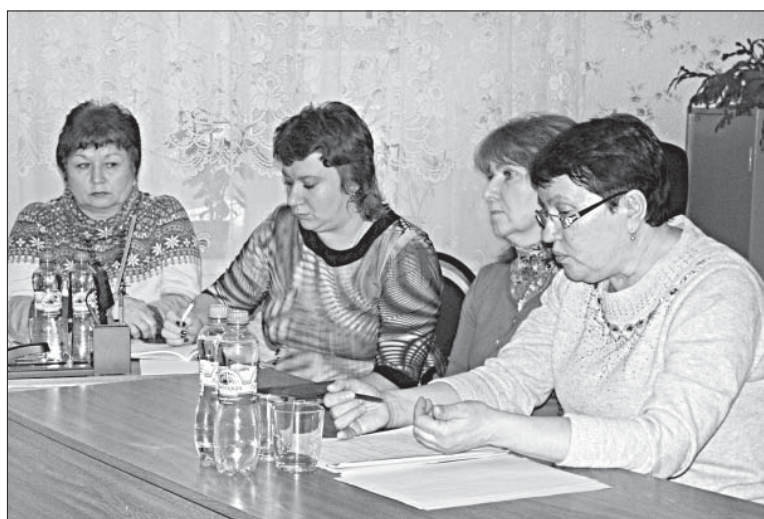
УЧАСТНИКИ «КРУГЛОГО СТОЛА» ОБСУДИЛИ, КАК ПРИВИТЬ СЕЛЯНАМ ЛЮБОВЬ К ЗДОРОВОМУ ОБРАЗУ ЖИЗНИ.

— Первое время было сложно уговорить людей явиться на медосмотр, они не понимали важность этого для своего здоровья. Теперь же, спустя несколько лет, легко идут на контакт, обследуются в нашей амбулатории. В прошлом году таковых было 278 человек, — говорит врач