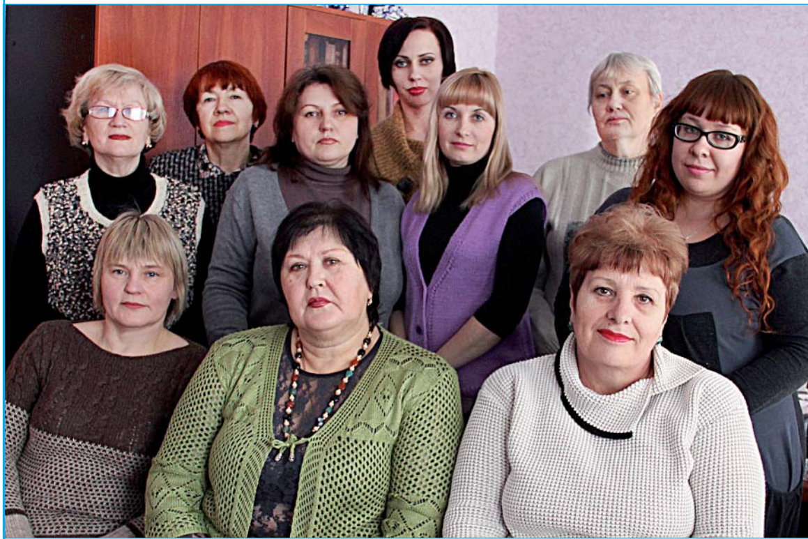
КОЛЛЕКТИВ РЕДАКЦИИ РАЙОННОЙ ГАЗЕТЫ «В КРАЮ РОДНОМ».