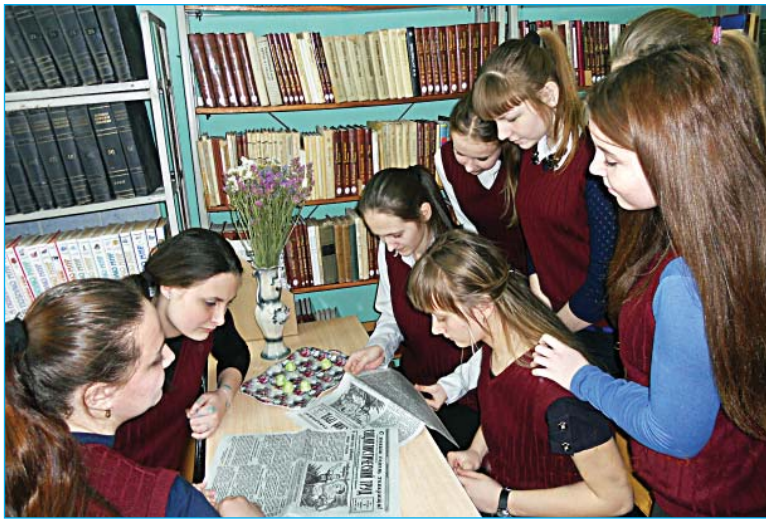
ПЕРВЫЙ ВЫПУСК «СОЦИАЛИСТИЧЕСКОГО ТРУДА» ВЫЗВАЛ ИНТЕРЕС. В МЕЖПОСЕЛЕНЧЕСКОЙ БИБЛИОТЕКЕ ЮНЫЕ ЧИТАТЕЛИ ОБСУДИЛИ СТАТЬИ РАЙОНКИ, ОПУБЛИКОВАННЫЕ 75 ЛЕТ НАЗАД.