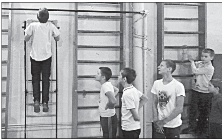
СОРЕВНУЮТСЯ УЧЕНИКИ ООШ ПОСЕЛКА ЕЛЕЦКИЙ.