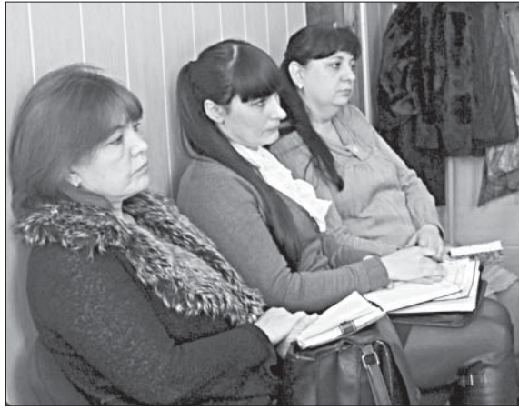
УЧАСТНИКИ «КРУГЛОГО СТОЛА» В ХМЕЛИНЦЕ ВЕЛИ ЗАИНТЕРЕСОВАННЫЙ РАЗГОВОР О ПРОПАГАНДЕ ЗДОРОВОГО ОБРАЗА ЖИЗНИ.

— Сегодня приходится констатировать, что высок уровень смертности по так называемым управляемым причинам, то есть это последствия неправильного образа жизни (злоупотребление алкоголем, несвоевременная диагностика заболеваний и т. п.). Все начинается в семье, здесь формируется культура поведения, здоровья. Если родители сами пассивны, предпочитают свой досуг проводить на диване, то и дети следуют их примеру. Подружки сегодня малоактивны. Мама с папой подарили компьютер, полагая, что так отвлекут ребенка от улицы. А лучше было бы приобрести