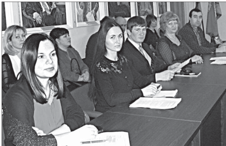
ДЕЛЕГАЦИЯ ЕЛЕЦКОГО РАЙОНА ПРИНЯЛА УЧАСТИЕ В ФОРУМЕ МОЛОДЫХ ДЕПУТАТОВ-ЕДИНОРОССОВ.

сах. Предварительное партийное голосование. Реализация образовательных партийных проектов», «Формы и методы работы молодых депутатов». Также на четвертой