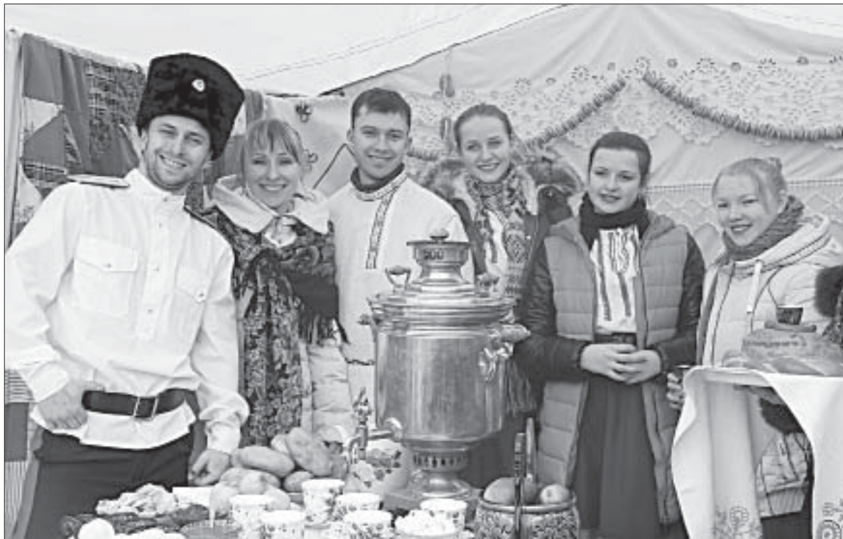
ЗА САМОВАРОМ — АРТИСТЫ ИЗ КАЗАЦКОГО СЕЛЬСКОГО ПОСЕЛЕНИЯ.