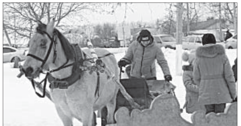
КАТАНИЕ НА ЛОШАДЯХ.