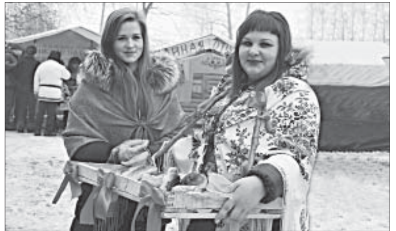
НА ЛОТКАХ — ГОРЯЧИЕ ПИРОЖКИ ДЛЯ ГОСТЕЙ.