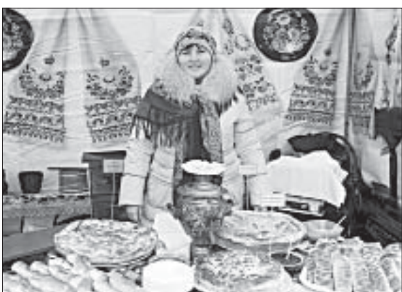
ПИРОГИ ИЗ ВОРОНЦА.