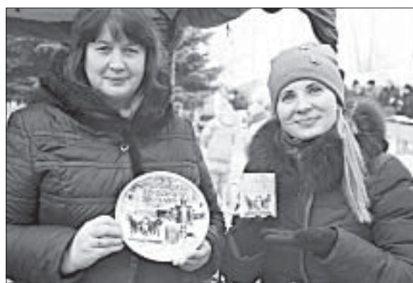
ХИТ ПРОДАЖ — КРУЖКИ И ТАРЕЛКИ С СИМВОЛИКОЙ ФЕСТИВАЛЯ.