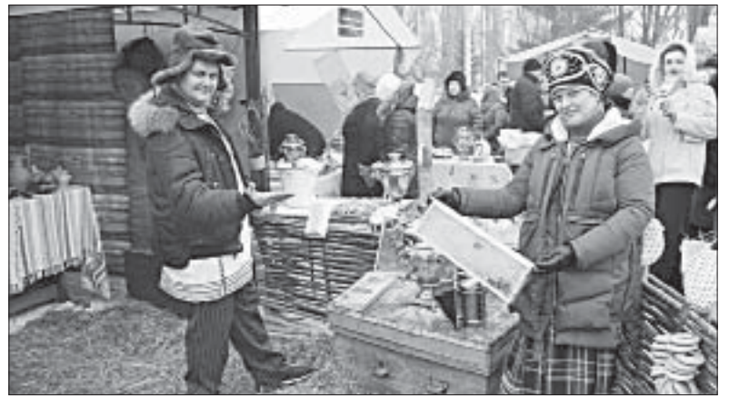
ПРИВЕТЛИВО ВСТРЕЧАЛО ГОСТЕЙ НА СВОЕМ ПОДВОРЬЕ АРХАНГЕЛЬСКОЕ ПОСЕЛЕНИЕ.

— В Нижневоргальском впервые попробовал чай с имбирем, — гово-