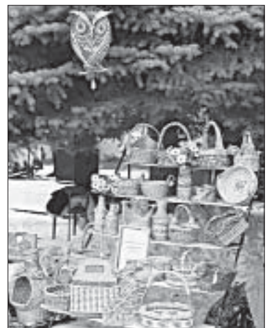
ВЫСТАВКА НАРОДНЫХ ПРОМЫСЛОВ.

Жюри подвело итоги. В первой номинации Казацкое сельское поселение заняло 1-е место, Архан-