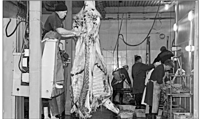
... И В ЦЕХЕ КООПЕРАТИВА «ЕЛЕЦКОЕ ПОДВОРЬЕ».