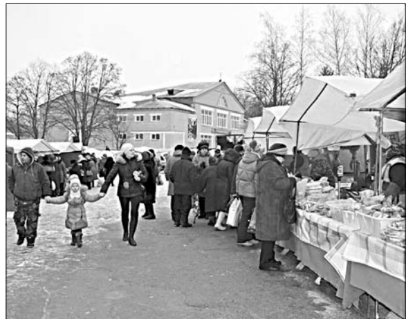
В ТОРГОВЫХ РЯДАХ БЫЛО МНОГОЛЮДНО.