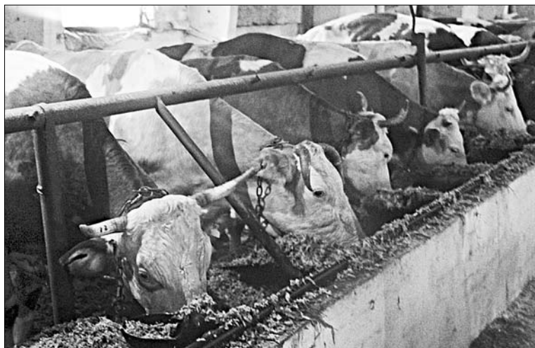
МОЛОКО У КОРОВЫ НА ЯЗЫКЕ.