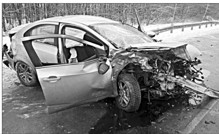
При содействии сотрудников ОГИБДД ОМВД России по Елецкому району подготовила А. МИТУСОВА.