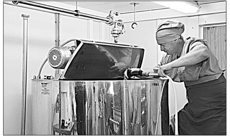
В МОЛОЧНОМ ЦЕХЕ КООПЕРАТИВА «ВИНТАЖ».