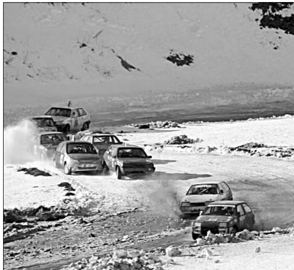
НА ТРАССЕ — УЧАСТНИКИ КРОССА.