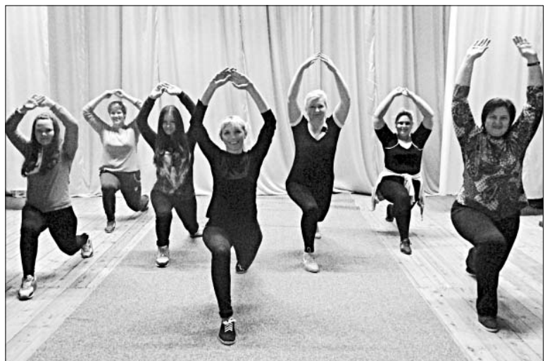
ЗАНЯТИЯ АЭРОБИКОЙ — ДЛЯ ТЕЛА И ДУШИ.