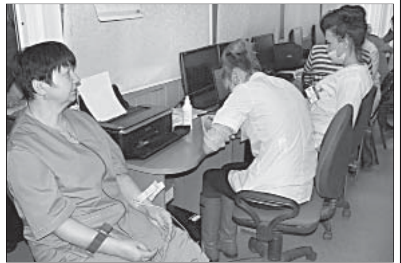
ПРОЦЕДУРА ЭКСПРЕСС-ОЦЕНКИ СОСТОЯНИЯ СЕРДЦА С ИСПОЛЬЗОВАНИЕМ КАРДИОВИЗОРА.

Люди, неравнодушные к своему будущему, проходят обследование, прислушиваются к рекомендациям