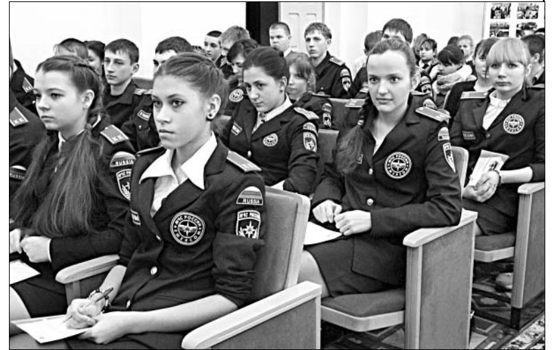
ПОЧТИ 120 РЕБЯТ УЧАСТВОВАЛИ В СЕМИНАРЕ.