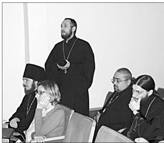
В ПЛЕНАРНОМ ЗАСЕДАНИИ АКТИВНОЕ УЧАСТИЕ ПРИНЯЛИ КАК МИРЯНЕ, ТАК И ДУХОВЕНСТВО.