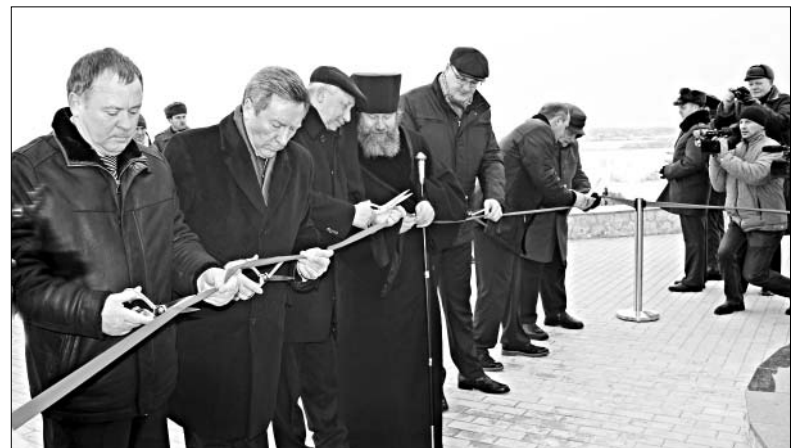
ОТКРЫТИЕ МОНУМЕНТА СЛАВЫ.

Деятельное участие в строительстве комплекса принимали рабочие филиала ООО «Газпром трансгаз Москва» «Елецкое ЛПУМГ», которое предоставляло строительную технику, транспорт, проводило строительные работы.