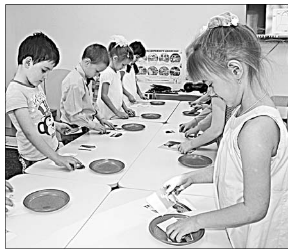
ВОСПИТАННИКИ СТАРШЕЙ ГРУППЫ СОБИРАЮТ КОЛОКОЛ, О КОТОРОМ УЗНАЛИ МНОГО НОВОГО.