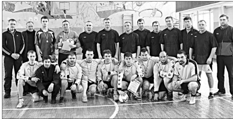
ПОБЕДИТЕЛИ И ПРИЗЕРЫ С ОРГАНИЗАТОРАМИ РАЙОННЫХ СОРЕВНОВАНИЙ ПО МИНИ-ФУТБОЛУ.