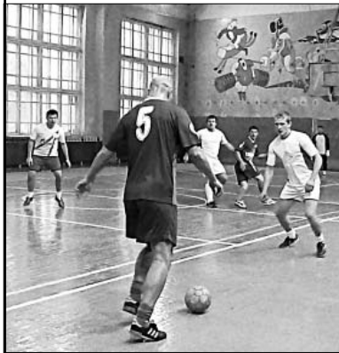
ТЕХНИЧНАЯ АТАКА — ЗАЛОГ ГОЛА.

— Нашу команду можно назвать ветеранской. Играем уже десять лет, в этом году юбилей. Увлечение футболом объединяет и дает силы бороться. А еще важно, что нас поддерживают. В частности, автономное учреждение по физкультуре и спорту