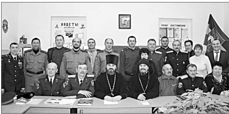
УЧАСТНИКИ «КРУГЛОГО СТОЛА».