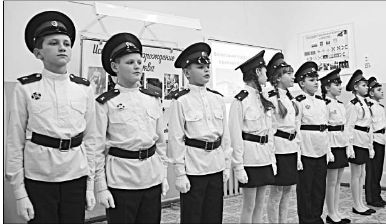
ВОСПИТАННИКИ КАДЕТСКОГО КЛАССА.