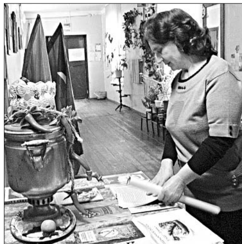
ВЫСТАВКА ЛИТЕРАТУРЫ ЗАИНТЕРЕСОВАЛА ГОСТЕЙ МЕРОПРИЯТИЯ. (Соб. инф.)

И еще один секрет. «Воргольские росы» — пример жизнелюбия, заора и творческой энергии. Это помогает им противостоять жизненным неурядицам.