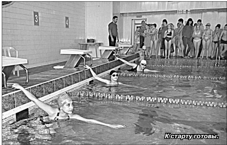
К старту готовы.