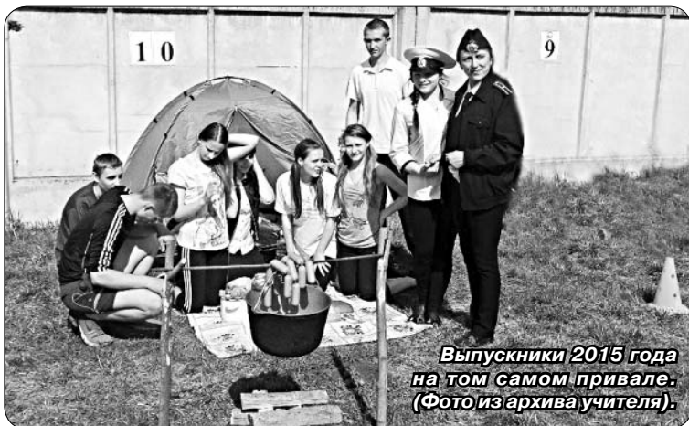
Выпускники 2015 года на том самом привале.

Это лето было не из легких. Постоянный стресс, где баллов хватает, где нет... Но мои ребята справились, надеюсь, они станут профессионалами в своем деле.