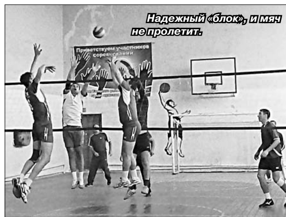
Надежный «блок», и мяч не пролетит.