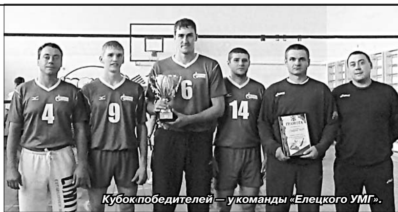
Кубок победителей — у команды «Елецкого УМГ».

За бронзовые награды кубка развернулась настоящая битва. Хозяева площадки и их соперники из Казаков основной матч завершили с ничейным счетом. И в дополнительном