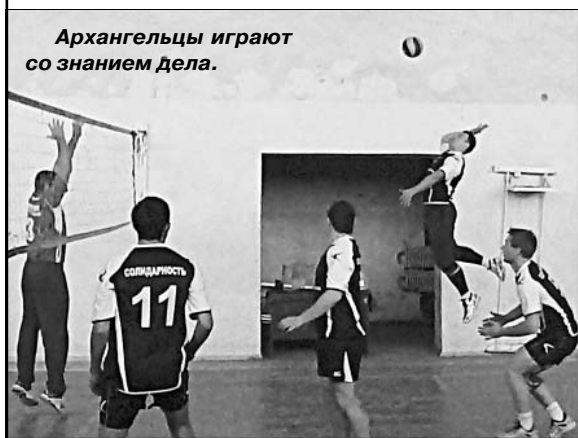
Архангелы играют со знанием дела.