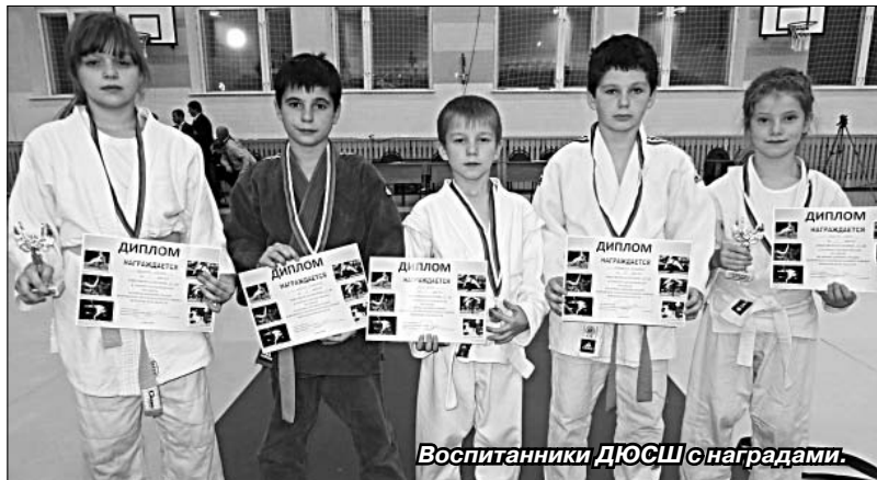
Воспитанники ДЮСШ с наградами.