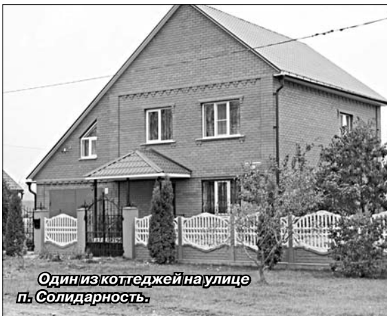
Один из коттеджей на улице П. Солидарность.