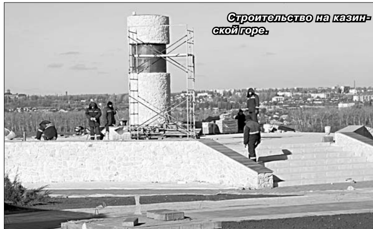
Строительство на казинской горе.

ратно, не портя общий вид населенного пункта. Да и дома — из современных материалов, красивые, опрятные, с благоустройством вокруг.