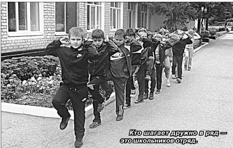
Кто шагает дружно в ряд — это школьников отряд.