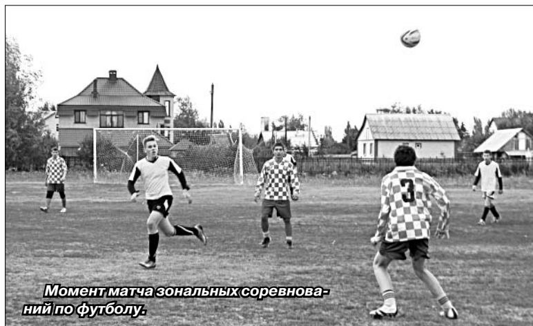
Момент матча зональных соревнований по футболу.