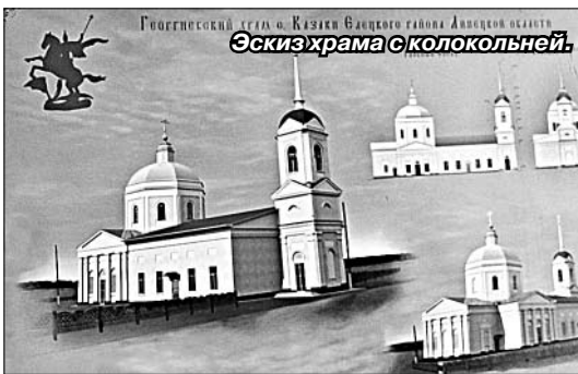
Эскиз храма с колокольней.

— Все дни провожу на земле — обрабатываю, вспахиваю. А тут узнал, что стройка грядет, вот и пришел. Так же сделали и мои