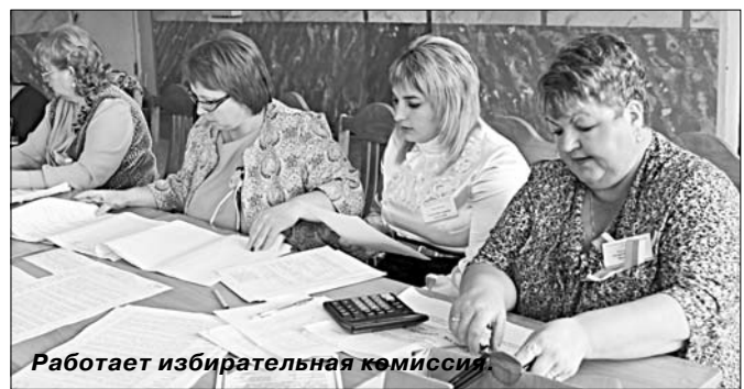
Работает избирательная комиссия.