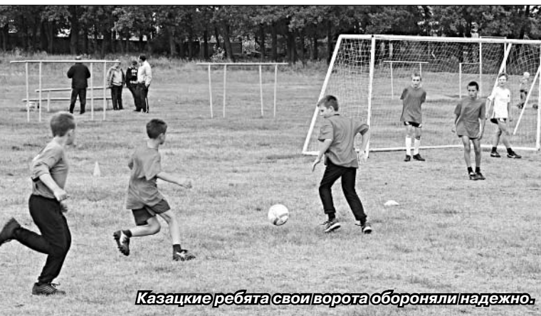
Казацкие ребята свои ворота обороняли надежно.