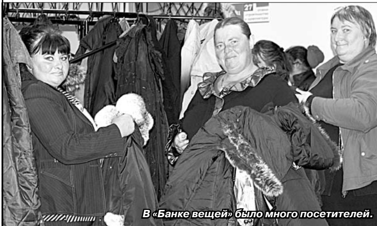
В «Банке вещей» было много посетителей.