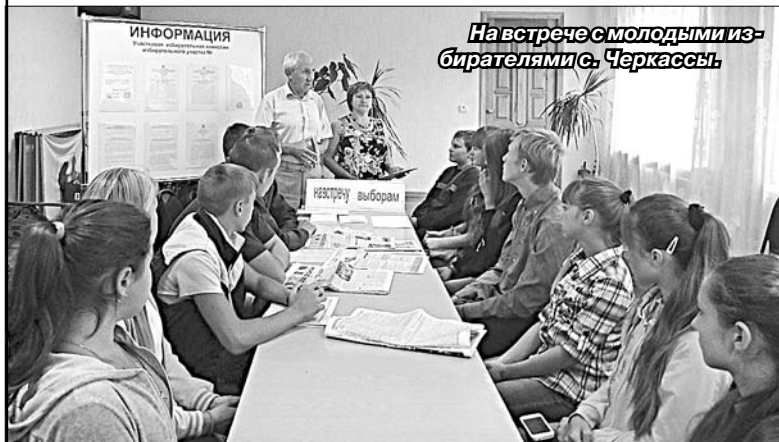
На встрече с молодыми избирателями с. Черкассы.