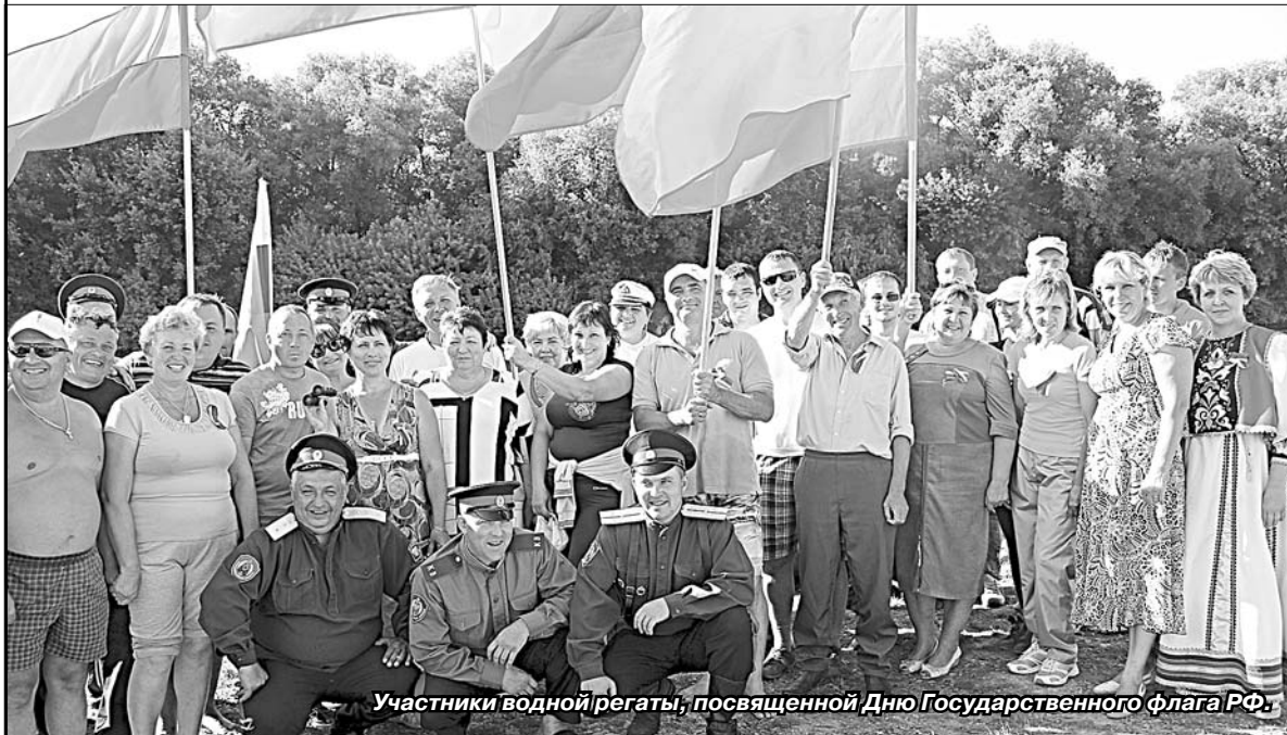
Участники водной регаты, посвященной Дню Государственного флага РФ.

В день российского флага первая районная регата стартовала от порогов Ольшанской плотины до села Голиково.