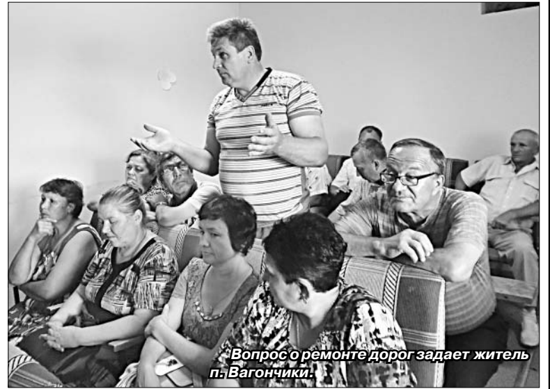
Вопрос о ремонте дорог задает житель п. Вагончики.