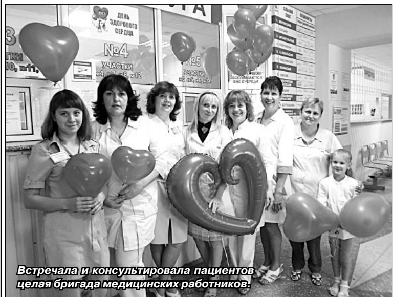
Встречала и консультировала пациентов целая бригада медицинских работников.

которые в силу занятости не могут посетить докторов, сделать необходимые анализы в рабочие дни.