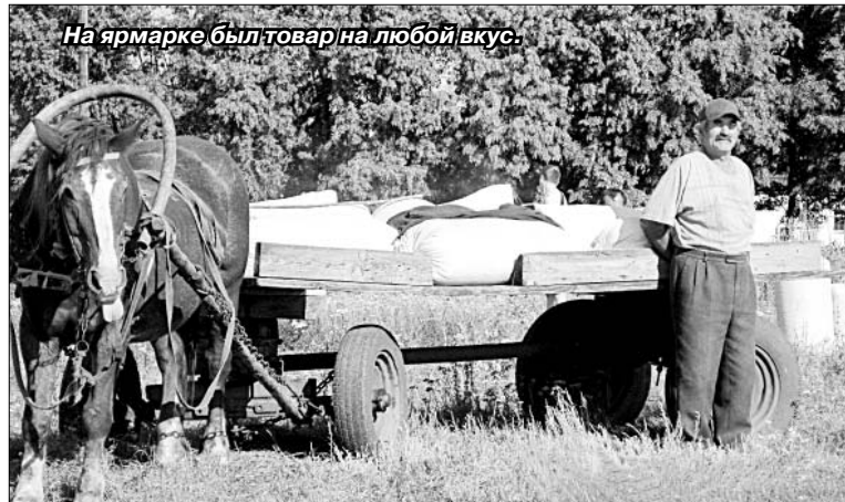
На ярмарке был товар на любой вкус.