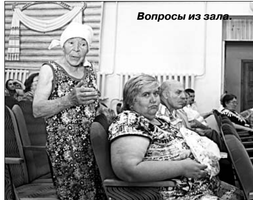
Вопросы из зала.

И вот настал черед задавать вопросы из зала. И «вечный» — о новом мосте через реку Быстрая Сосна.