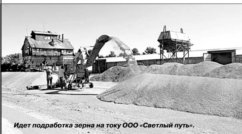
Идет подработка зерна на току ООО «Светлый путь».

Что касается самой уборки, то она прошла на высокоорганизованном уровне. Несколько экипажей комплексно убрали все поля за четыре дня.