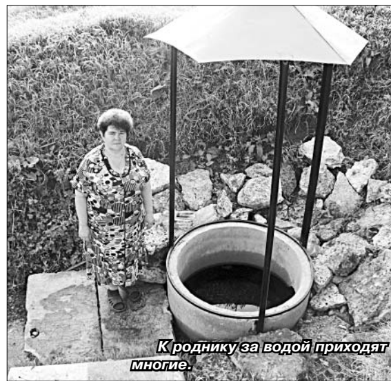
К роднику за водой приходят многие.