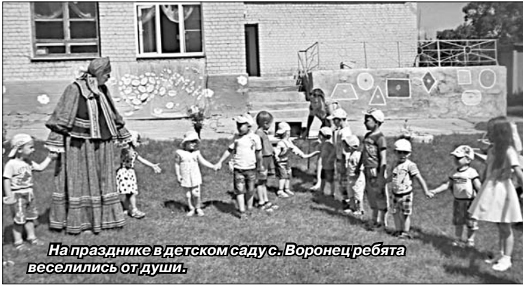
На празднике в детском саду с. Воронец ребята веселились от души.

В детском саду п. Газопровод в гости к дошкольникам пришли сказочные персонажи. «Бабушка-хозяюшка» порадовала пирогами и играми. Дети рассказали присутствующим о празднике, его истории и традициях, играли, веселились, пели песни, танцевали.