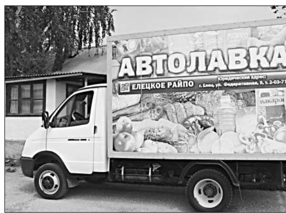
В магазин на колесах жители спешат к назначенному часу. Автолавка делает в каждом селе по несколько остановок.