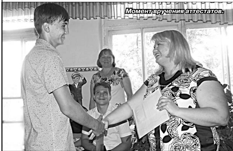
Момент вручения аттестатов.