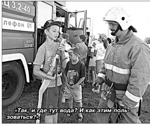
«Так, и где тут вода? И как этим пользоваться?»