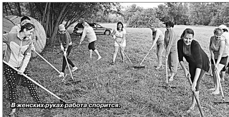
В женских руках работа спорится.