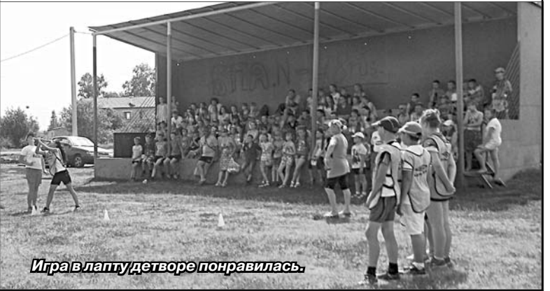
Игра в лапту детворе понравилась.