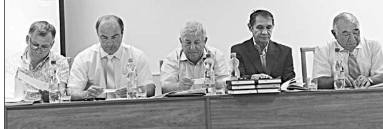
В президиуме конференции.

ВЫПИСЫВАЙТЕ И ЧИТАЙТЕ РАЙОННУЮ ГАЗЕТУ «В КРАЮ РОДНОМ» — В КАЖДОМ ДОМЕ! ОСТАВАЙТЕСЬ С НАМИ!