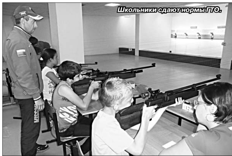
Школьники сдают нормы ГТО.