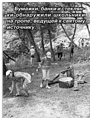
Бумажки, банки и стекланы обнаружили школьники на тропе, ведущей к святому источнику.

— С ребятами мы постоянно ходим к источнику. Здесь есть скамеечка,