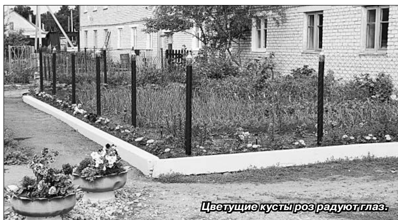
Цветущие кусты роз радуют глаз.