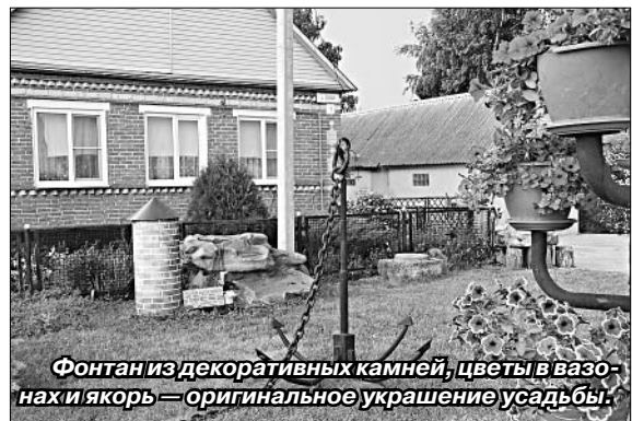
Фонтан из декоративных камней, цветы в вазах и якорь — оригинальное украшение усадьбы.

временно радуются: не каждый может увидеть, пусть и уменьшенную, копию такого сооружения. Кстати сказать, и якорь неподалеку от маяка размещен.