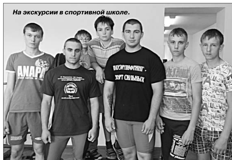
На экскурсии в спортивной школе.

Увиденное в школе не оставило детей равнодушными. Желающих записали в секцию.