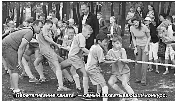
«Перетягивание каната» — самый захватывающий конкурс.