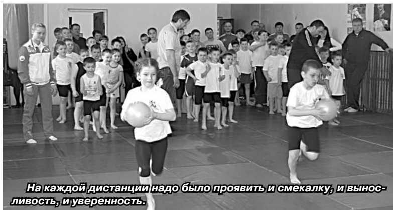
На каждой дистанции надо было проявить и смекалку, и выносливость, и уверенность.

На состязаниях ребята очень рассчитывали на поддержку родителей, ба-