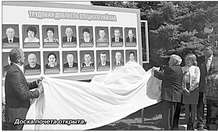
Доска почета открыта.