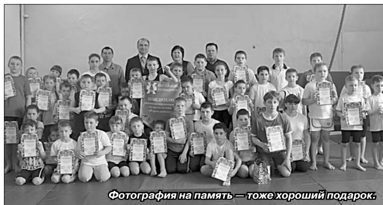
Фотография на память — тоже хороший подарок.