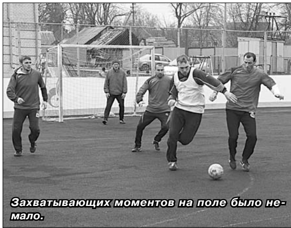
Захватывающих моментов на поле было немало.

Борьба за награды оказалась непростой. «Солидарность» в матче за третье место уступила команде «Елецкое УМГ», а «Елецкая Бавария» (она, кстати, заняла третье место в областном чемпионате по мини-футболу) обыграла «Воронец» и стала обладателем кубка.