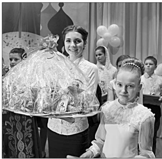
Участники фестиваля с подарками.

коллективов, участников. Каждый ребенок получил пасхальный подарок — кулич, крашенные яйца и иконку святого. Отец Максим благословил всех.