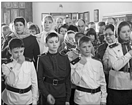
Казачий кадетский класс на службе в храме с. Казаки.