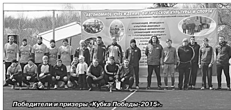
Победители и призеры «Кубка Победы-2015».

После первого дня турнира стали известны четыре сборных, которым и предстояло побороться за победу, — «Солидарность», «Елецкое УМГ», «Елецкая Бавария», «Воронец». Старт финальным поединкам «объявили» члены клуба исторической реконструкции «Копье», подготовившие показательное выступление.