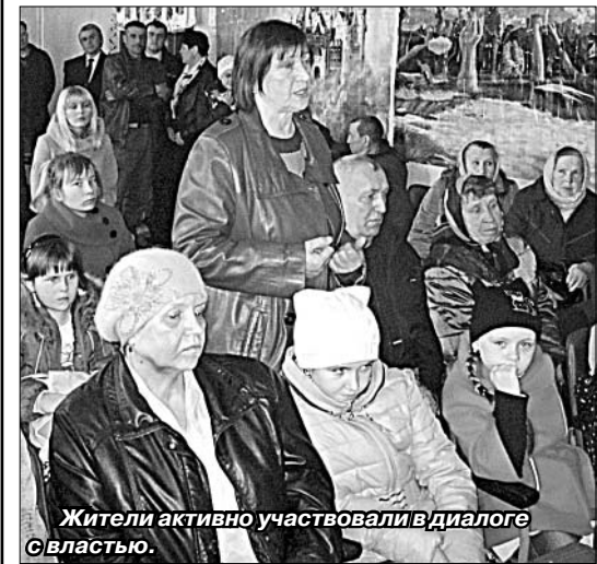
Жители активно участвовали в диалоге с властью.