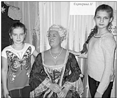
Ученики школы п. Елецкий в художественном отделе музея г. Ельца среди восковых фигур.