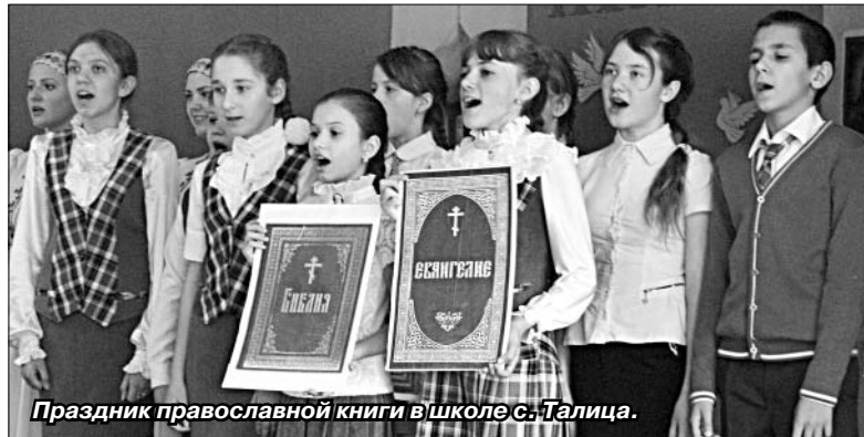
Праздник православной книги в школе с. Талица.