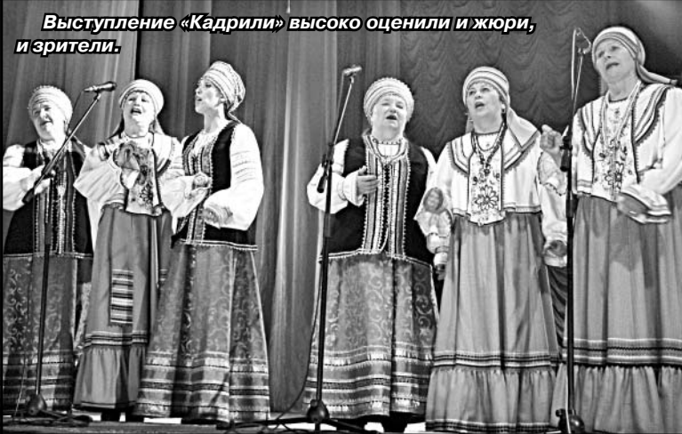
Выступление «Кадрили» высоко оценили и жюри, и зрители.