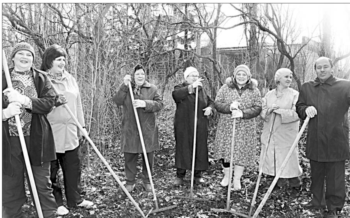
Работники администрации, ДК, детского сада Лавского поселения — самые активные участники всех субботников.