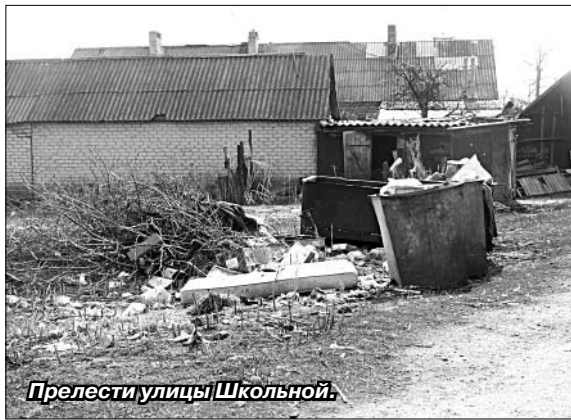
Прелести улицы Школьной.