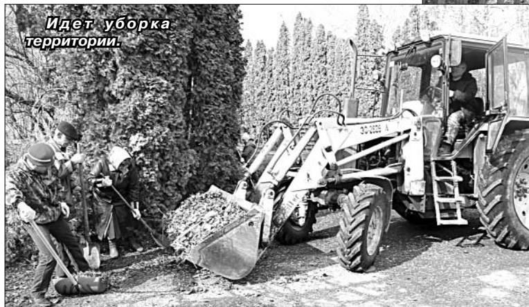
Идет уборка территории.

металлические трубы. Вкопаем их, поработаем сваркой. Думаю, что к 1 Мая все закончим.