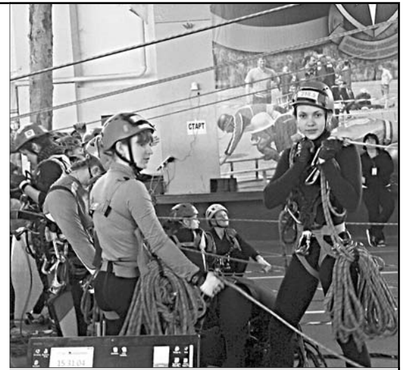
Перед стартом важно еще раз проверить исправность снаряжения.