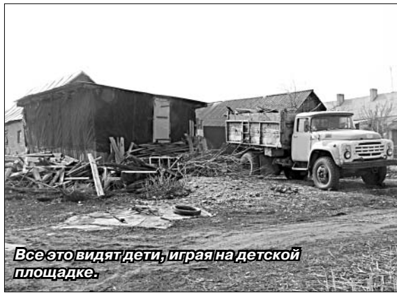
Все это видят дети, играя на детской площадке.