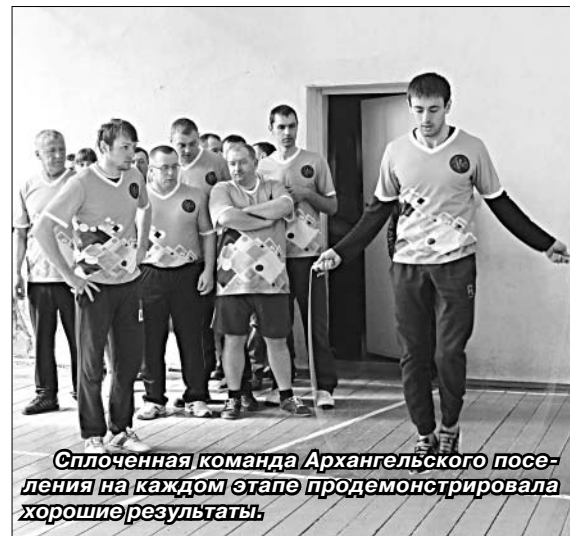
Сплоченная команда Архангельского поселения на каждом этапе продемонстрировала хорошие результаты.