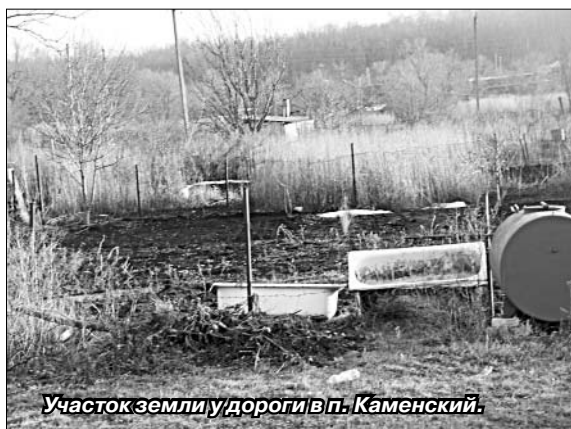
Участок земли у дороги в п. Каменский.