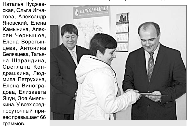
Момент вручения наград в ООО «Светлый путь».