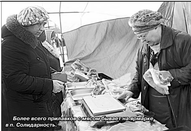
Более всего прилавков с мясом бывает на ярмарке в п. Солидарность.

Сегодня ярмарочное движение в районе «пишет» свою новейшую историю. В каждом поселении написана уже не одна, а несколько страниц. И ныне сельская ярмарка выполняет свое прямое предназначение — обеспечивать недорогим, но качественным продуктом людей, каждый раз все больше увеличивая ассортимент, удовлетворяя спрос. Все чаще ярмарки в поселениях района получают статус областных, на которых можно купить различный товар, в том числе и у местных товаропроизводителей.