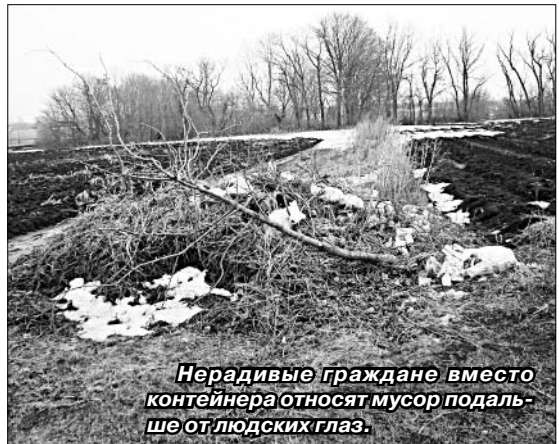
Нерадивые граждане вместо контейнера относят мусор подальше от людских глаз.