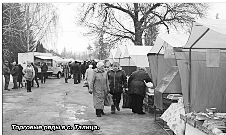
Торговые ряды в с. Талица.