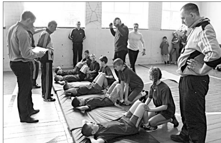
Учителя физкультуры пристально наблюдали за воспитанниками, поддерживая и при необходимости подгоняя их.