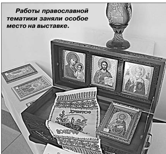
Работы православной тематики заняли особое место на выставке.