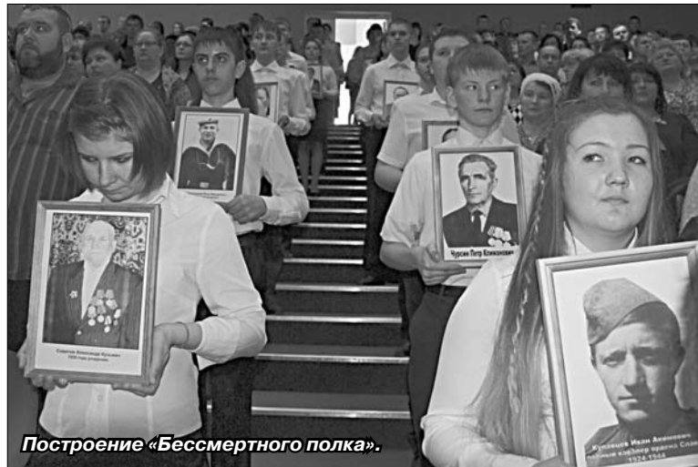
Построение «Бессмертного полка».

В зал входят дети. Они вносят портреты воинов, не вернувшихся с войны в свои села и деревни. Более 200 фотографий в детских руках «выстроились» в проходах. Они не только с нами в этот день, они навечно записаны в «Бессмертный полк». В зале плывет минута молчания.