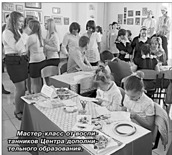
Мастер-класс от воспитанников Центра дополнительного образования.