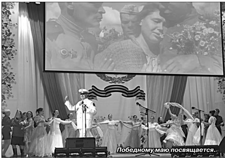
Победному маю посвящается.

Администрация Елецкого района приглашает к диалогу и участию в работе совещания всех желающих жителей района, представителей общественных организаций, объединений.