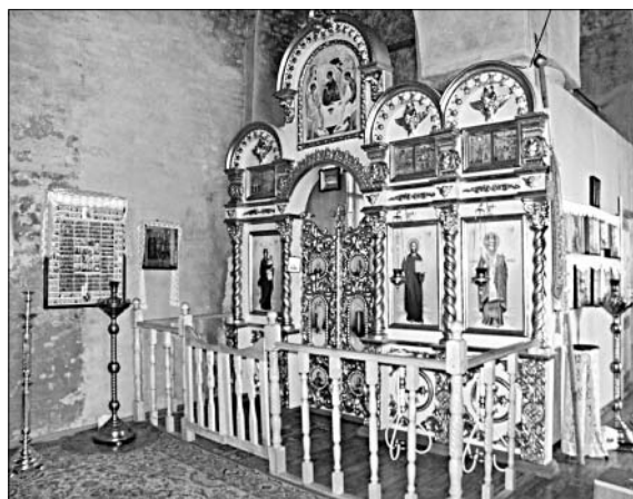
Возрождение храма началось с восстановления алтаря, над которым трудились всем селом.