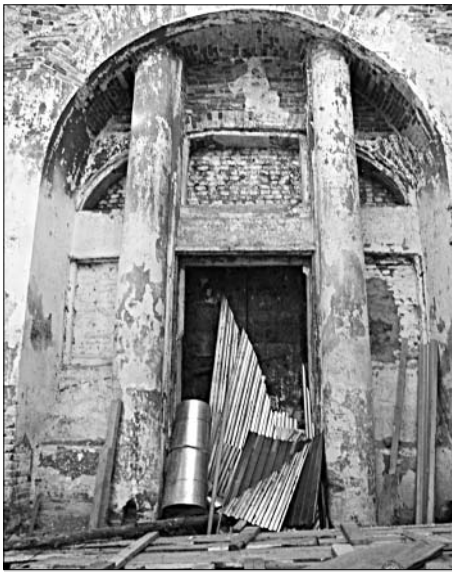
От прежнего храма остались лишь обветшалые стены.

Сегодня сельчане мечтают не только о возрождении оставшихся приделов. Сейчас для них очень важно укрепить колокольню, которая постепенно осыпается, и побелить помещение, где проходят богослужения, чтобы наконец-то серые стены и следы былых потопов были скрыты под белоснежным одеянием. Только вот средств на это у немногочисленного прихода нет. Каждую службу они молятся, чтобы нашлись неравнодушные христиане, которые смогли бы помочь оживить дорогу сердцу святыню. Сельчане верят, что таких людей им обязательно пошлет Господь. И тогда вместе они завершат начатое и поднимут из руин великолепный, могучий храм.