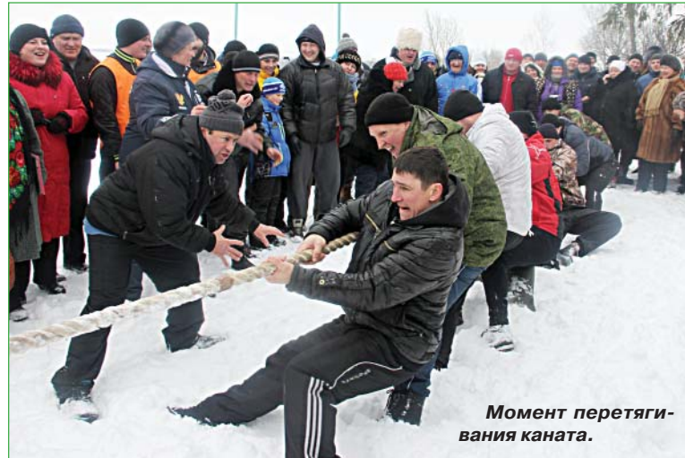
Момент перетягивания каната.

Женщины в возрастной категории старше 45 лет также уверенно держались на лыжах и показали замечательное время. Было видно — на лыжне они не новички, бегают