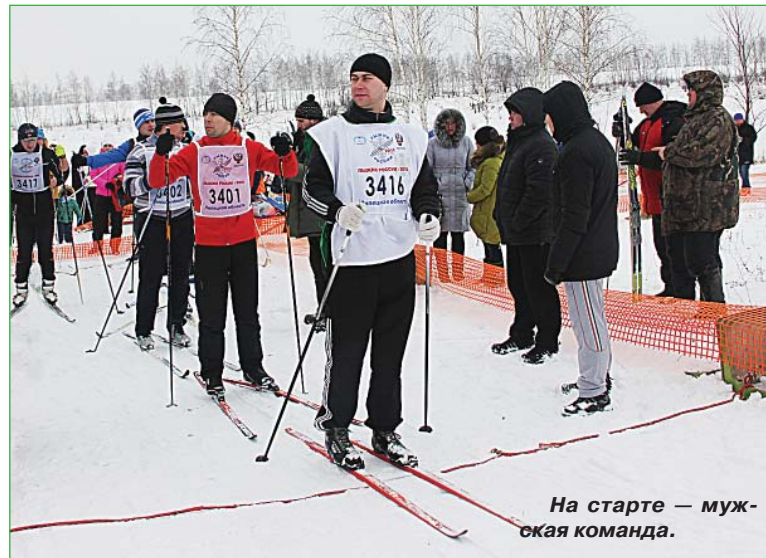
На старте — мужская команда.

— Спорт в семье — это образ жизни, — говорит мама. — С малых лет мы детей закаляем, играем в волейбол, футбол. Зимой лыжи, коньки — почти каждый день. И тот,