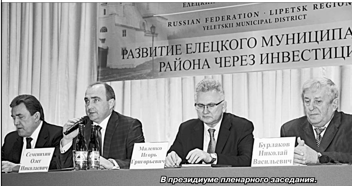
В президиуме пленарного заседания.

В Елецком районе прошла ярмарка инвестиционных проектов. 15 сельских поселений, пищевые и промышленные предприятия среднего и малого бизнеса, фермерские хозяйства, кредитные кооперативы, руководители г. Ельца и соседних районов не только рассказали о своих возможностях, но и продемонстрировали их. В течение полутора часов проходили круглые столы, презентации, живое творческое общение, знакомства.