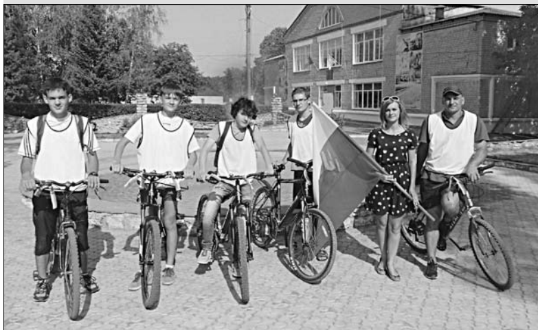
Участники велопробега, посвященного Дню государственного флага России.