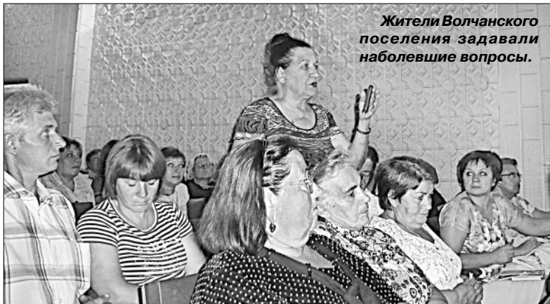
Жители Волчанского поселения задавали наиболее острые вопросы.

ведь по итогам прошлой встречи с главой района, представителями служб райадминистрации был решен острейший вопрос ремонта дорог.