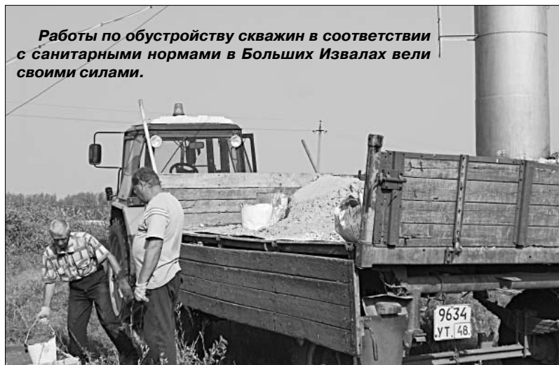
Работы по обустройству скважин в соответствии с санитарными нормами в Больших Извалах вели своими силами.