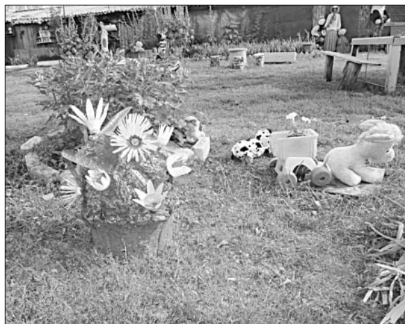
Всегда «цветущий» пенек радует глаз и греет душу жителям деревни Казинка.