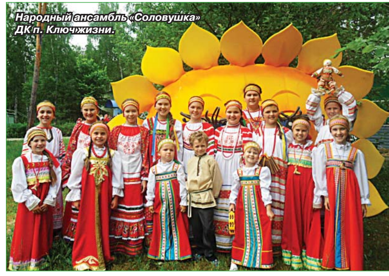
Народный ансамбль «Соловушка» ДК п. Ключизни.