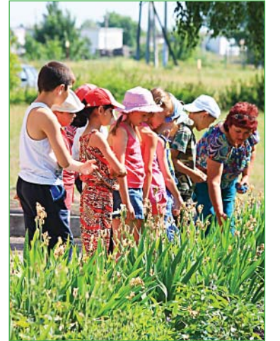
В День охраны окружающей среды соколята побывали на экскурсии.

Учебный год завершился, но в стенах школы п. Сокольце