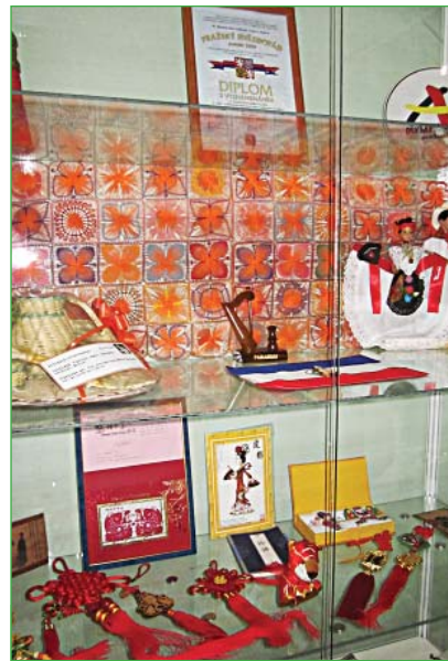
Парагвайское кружево, куклы в национальных костюмах пополнили коллекцию Музея миротворчества ЕГУ.