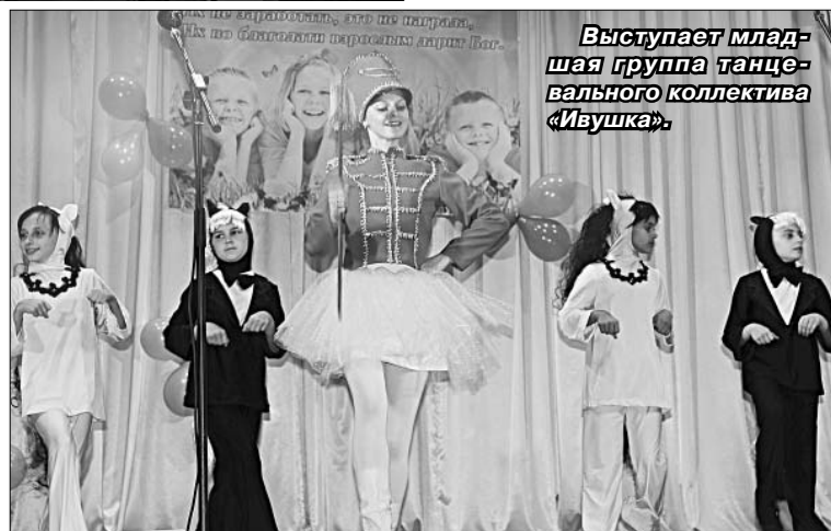
Выступает младшая группа танцевального коллектива «Ивушка».