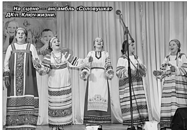
На сцене — ансамбль «Соловушка» ДК п. Ключ жизни.