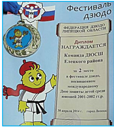
Такой диплом и медаль привезли с фестиваля дзюдо воспитанники районной ДЮСШ.