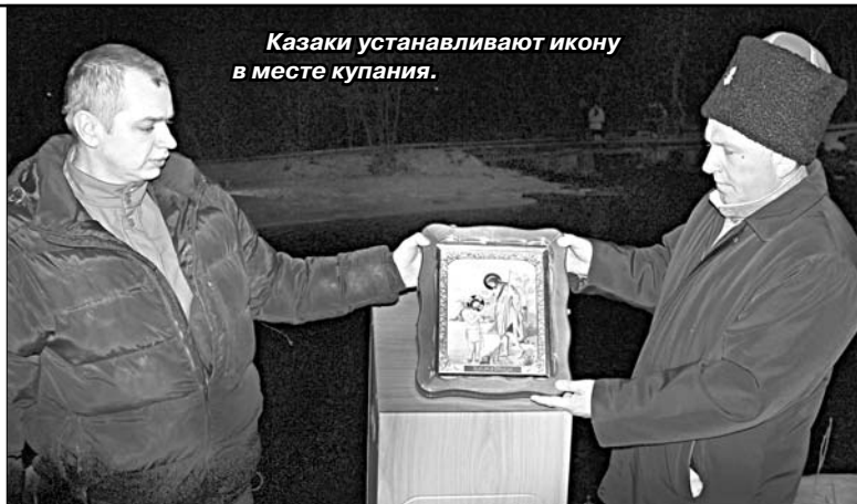
Казаки устанавливают икону в месте купания.