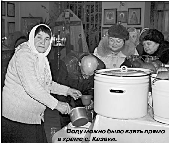
Воду можно было взять прямо в храме с. Казаки.