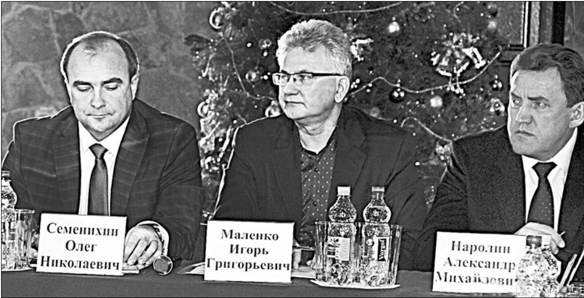
Рабочий момент «круглого стола»: в диалоге — глава района Олег Семенихин, начальник Управления инвестиций и международных связей Липецкой области Игорь Маленко, генеральный директор ОАО «Корпорация Развития Липецкой области» Александр Наролин.

Впервые в истории района состоялось заседание «круглого стола» с бизнес-сообществом.