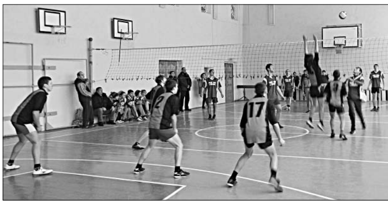
Волейбол — игра командная.

методист Центра дополнительного образования детей.