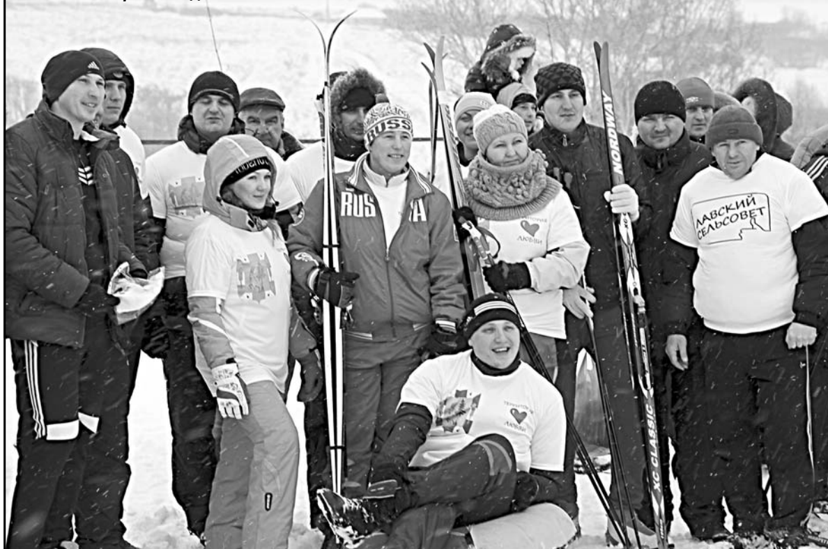
Участники прошлой «Лыжи России» из Лавского поселения.