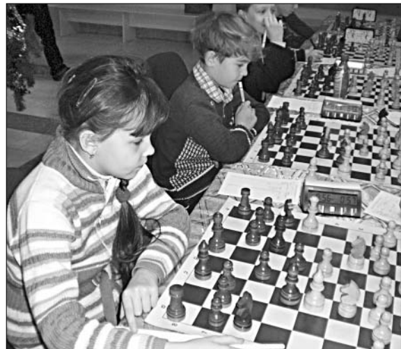
За шахматной доской — юные спортсмены.