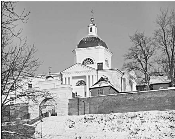
Знаменский монастырь г. Ельца.