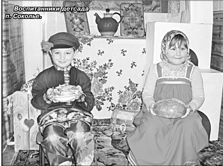
Воспитанники детского сада п. Соколье.