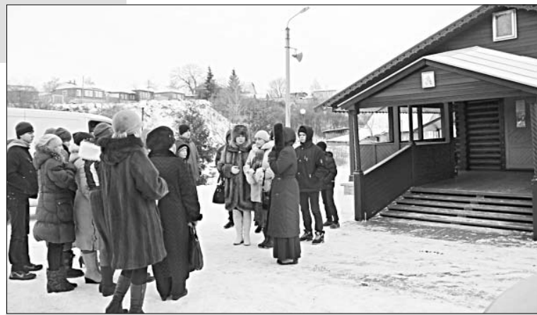
Экскурсия вызвала интерес у ребят и у педагогов.

Насельники были переведены в Воронежский Покровский монастырь, а на пепелище остались две старицы, наотрез отказавшиеся покинуть обитель. Они жили в уцелевшем погребке и неустанно молились о восстановлении святыни. Вскоре на пожертвования прихожан на Каменной горе был вновь возведен деревянный храм во имя Рождества Пресвятой Богородицы. Сюда собрались сестры, искавшие спасения в иноческой жизни. В 1778 году в Знаменский женский монастырь была принята послушницей Мелания — впоследствии местной блаженная затворница — великая подвижница, прожившая здесь 58 лет и скончавшаяся в затворе в 1836 году.