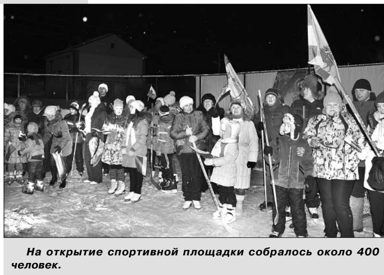
На открытие спортивной площадки собралось около 400 человек.