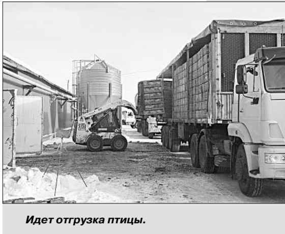
Идет отгрузка птицы.

ной организации труда, выходит, это вполне возможно.