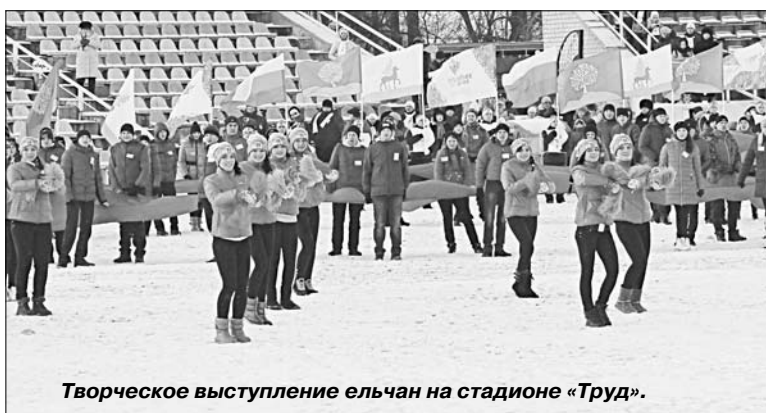
Творческое выступление ельчан на стадионе «Труд».