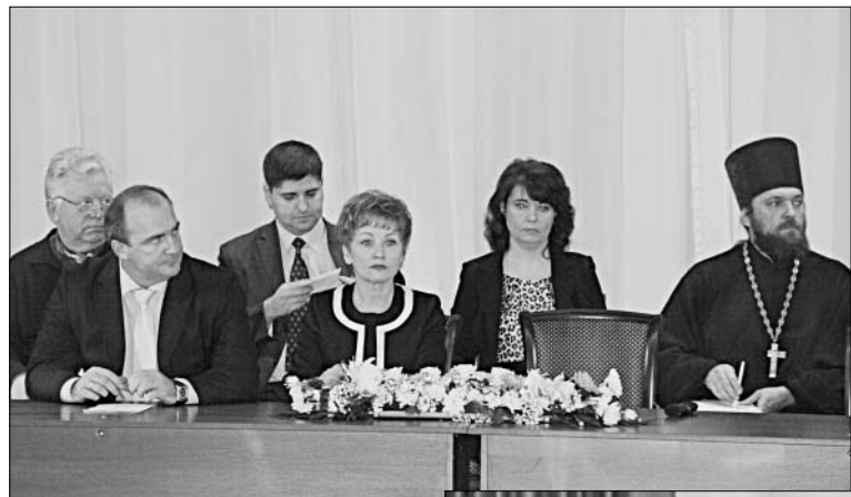
Президиум Рождественских чтений.

сматривал православную литературу, сувениры в церковной лавке. Рождественские чтения Елецкой епархии «Преподобный Сергий. Русь. Наследие, современность, будущее», приуроченные к 700-летию со дня рождения святителя, проходили в обстановке теплоты, душевного подъема.