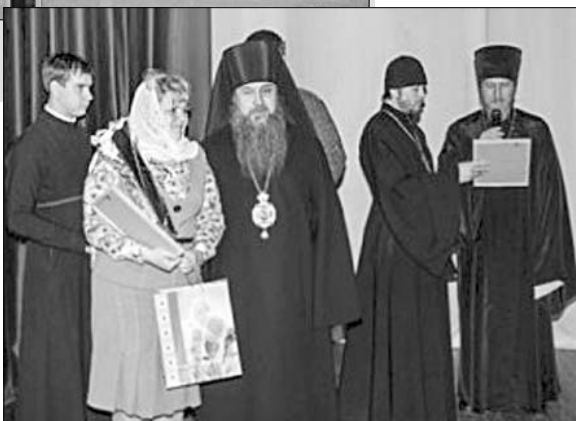
Торжественный момент награждения.

— Однако сегодня во многих странах пересмотрели нормы морали и нравственности, — подчеркнул отец Максим. — Разрушаются духовные ценности вопреки воле