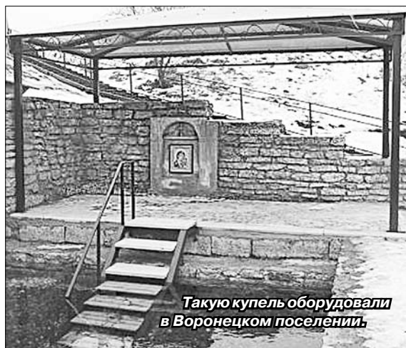
Такую купель оборудовали в Воронежском поселении.

нырнуть в ледяную купель. Это недопустимо и по христианским канонам, и потому, что опасно для жизни и здоровья.