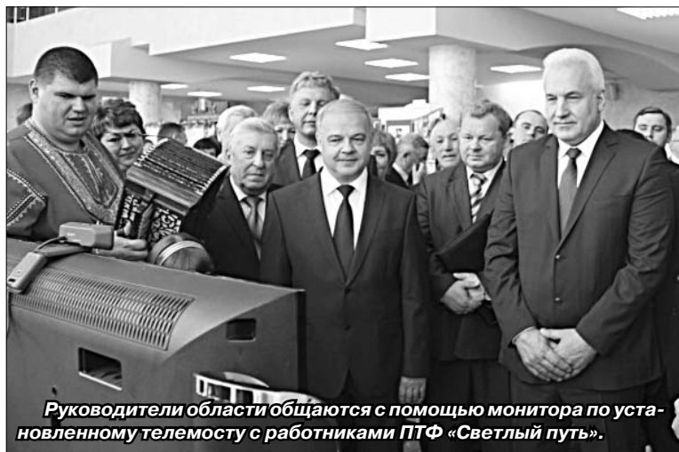
Руководители области общаются с помощью монитора по установленному телемосту с работниками ПТФ «Светлый путь».

выставке в своеобразной летописи развития Липецкой области, ее шестидесятилетнем пути.