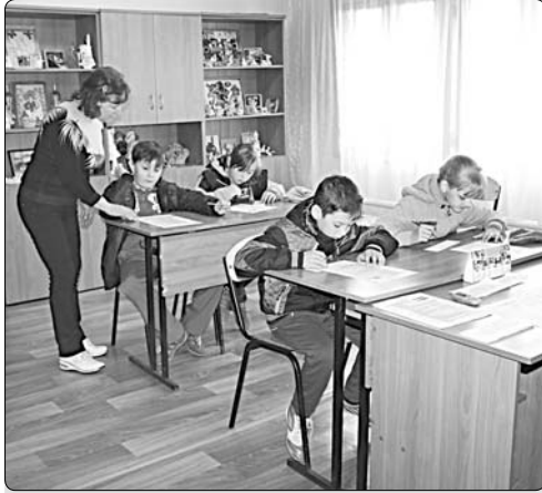
Идет экзамен по правилам дорожного движения.