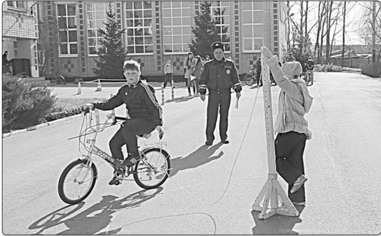
Фигурное вождение велосипеда.