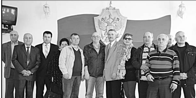
Ветераны ОМВД России по Елецкому району.

Приветствовал коллег также и председатель Совета ветеранов МВД