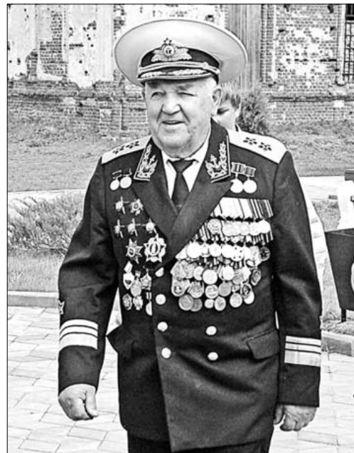
Адмирал С. Бутов.

поля России, это были бы слезы счастья и гордости за родной флот, которому он отдал половину своей жизни.