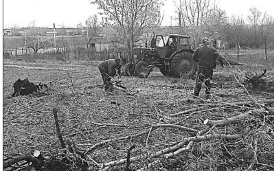
Жители Ольховца на субботнике.

Порядок в общем доме и должен быть делом общим.