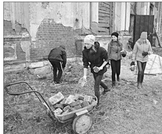
Идет уборка территории сельского храма.