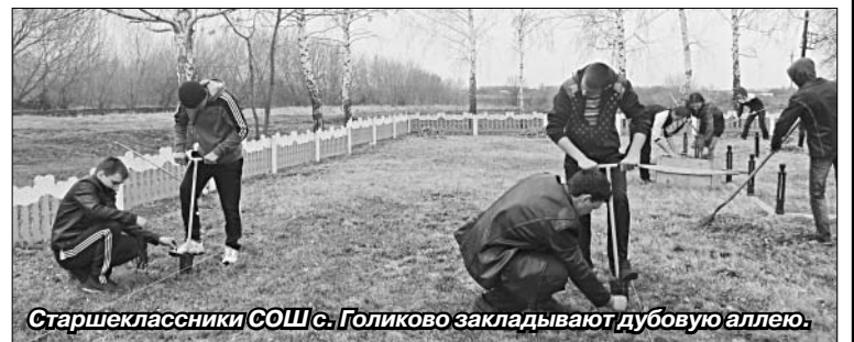
Старшеклассники СОШ с. Голиково закладывают дубовую аллею.