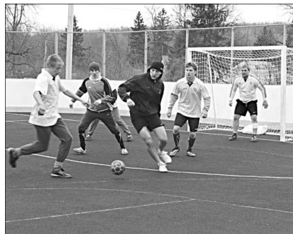
«Такой мы любим футбол».