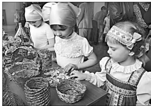
Выставка детских работ вызвала большой интерес.