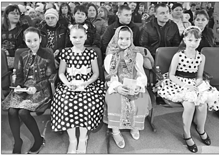
Детское жюри фестиваля.

Многие участники обратились к фольклору. Самая юная конкурсантка