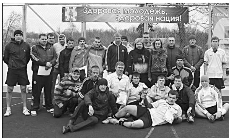
Победители и призеры первого кубка «Победа».

самочувствия на стадион прийти не смог, и подарок, который подготовили для него, пришлось вручить ветерану позже.